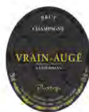
272 CHAMPAGNE VRAIN-AUGE