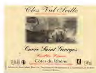
266 DOMAINE CLOS VALSEILLE