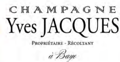
363 CHAMPAGNE YVES-JACQUES