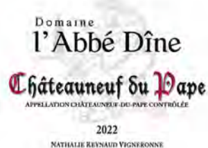
222 DOMAINE L'ABBE DINE

Facebook YouTube Les_Chevaliers DUNKERQUE