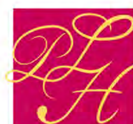
302 CHAMPAGNE LASSALLE-HANIN