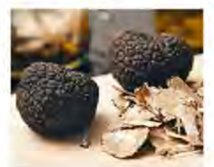
380 MISS CROQUE PAPY TRUFFES